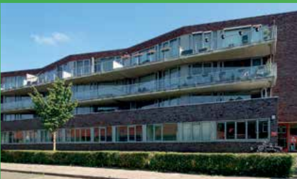
Palembangstraat 13 Groningen vraagprijs € 345.000,- k.k.