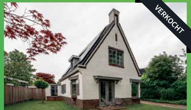
Waterhuizerweg 32 Haren verkocht