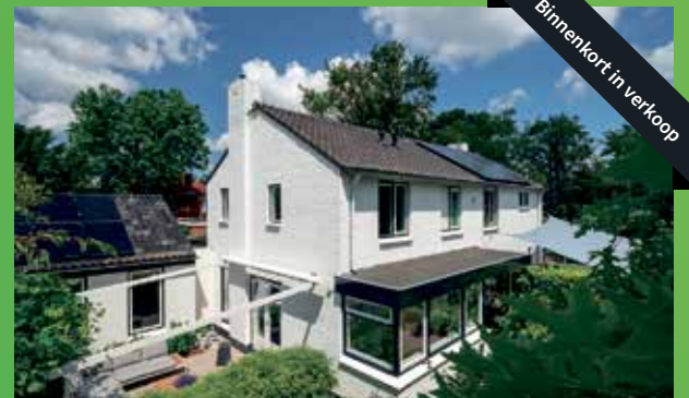
Onnerweg 45 Haren binnenkort in verkoop