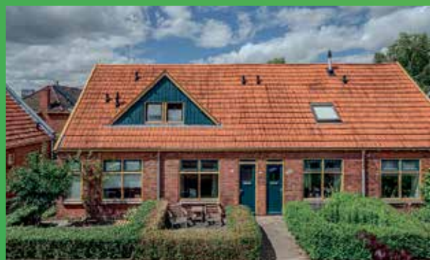
Meidoornpad 36 Groningen vraagprijs € 285.000,- k.k.