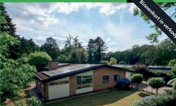
Steenkamp 9 Haren binnenkort in verkoop