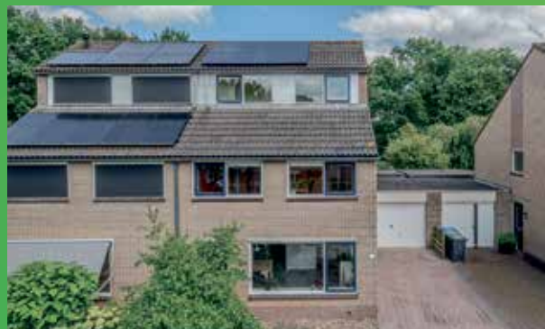
Schatstuk 16 Haren vraagprijs € 595.000,- k.k.