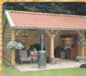
Kapschuur van Larix schaaldelen 3.00 x 6.00 m.

Wij bouwen voor u sierlijke houten garages, loodsen zomerhuizen, paardeboxen en schuurtjes.