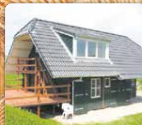
Huis met veranda 6.00 x 10.00 m. compl. geïsoleerd. Sneldakpannen, garage/berging met hobbyruimte. (Richtprijs compleet geplaatst) € 55.000,-