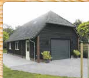
Garage/berging met stolpdak Gepotdekseld hout met gebakken pannen 5.00 x 10.00 m.