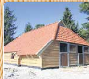
Schuur/carport inclusief 2 paardenboxen en binnenaftimmering/stalen kozijnen (Richtprijs compleet geplaatst) €25.000,-

De Riet 5 • 9843 AR • Grijpskerk Tel: 0594 213 977 • Fax: 0594 213 965 info@hiemstrahoutbouw.nl www.hiemstrahoutbouw.nl