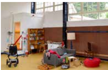
Gymlokaaltje nu tijdelijk als huiskamer in gebruik...

op trainen. Rond 2009 is de school nog gerenoveerd. In 2013 fuseerde de openbare school met de christelijke en kwam De Meent leeg te staan. Wachtend op een tweede leven.