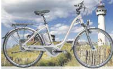
Flyer collectie 2014: Next Generation

Flyer 2014 next generation De beste elektrische fiets ooit!