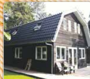
Zomerhuis aan het Paterswoldsemeer uitgevoerd in gepotdekseld hout met gebakken pannen.