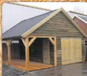
Garage 6.00 x 6.00 m. met inpanidige luifel 6.00 x 2.50 (Richtprijs compleet geplaatst) €13.000,-