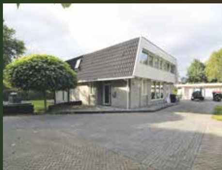
Elsschotlaan 30, Groningen € 789.000,- k.k.