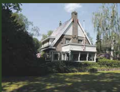
Rijksstraatweg 75, Glimmen € 595.000,- k.k.