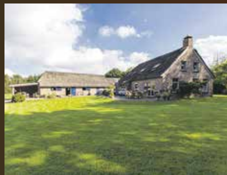
Groningerstraat 107, De Punt € 745.000,- k.k.