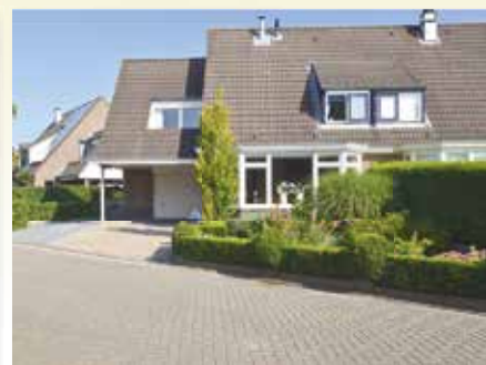
Oldengarde 35 Norg. Vraagprijs € 275.000,- k.k.