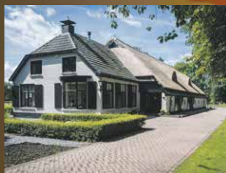
Viaductweg 57, Haren € 1.495.000,- k.k.