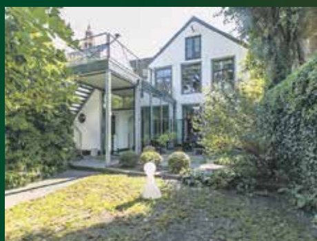
Lutkenieuwstraat 18B, Groningen € 1.045.000,- k.k.