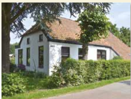
Dorpsweg 6 Onnen Vraagprijs € 339000,- k.k.