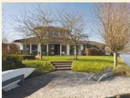
Vechtlaan 12 Kropswolde. Vraagprijs € 579.000,- k.k.