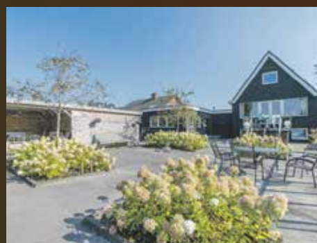
Meerweg 181, Haren € 845.000,- k.k.