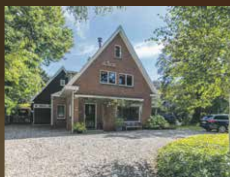
Rijksstraatweg 90, Glimmen € 795.000,- k.k.