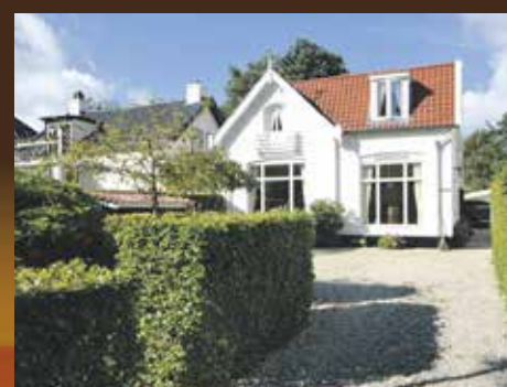
Rijksstraatweg 293, Haren € 469.000,- k.k.