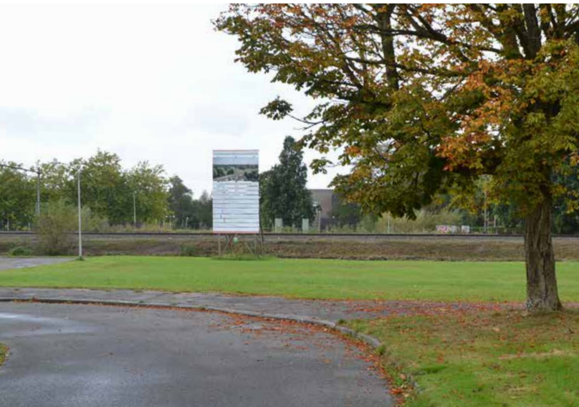
Deze plek aan de Wederikweg moet de tunnel komen

Komt die tunnel bij het station er nu wel of niet. Inwoners van Oosterhaar vragen dat zich af, want na vijf jaar is er nog geen spade de grond ingegaan.