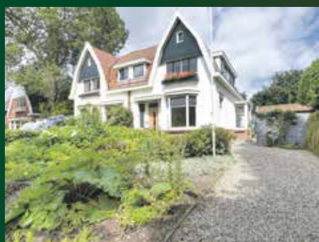
Stationsweg 34, Haren € 589.000,- k.k.