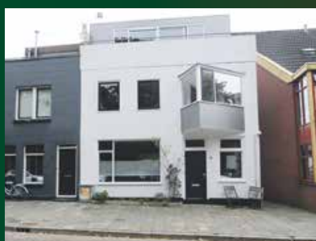
Noorderbinnensingel 77, Groningen € 375.000 vanafprijs