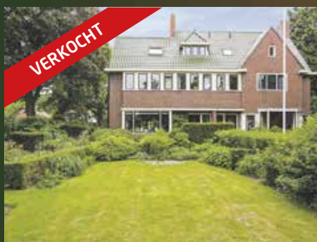
Rijksstraatweg 255A Haren