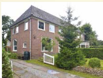
Mottenbrink 1b Onnen. Vraagprijs € 279.000,- k.k.