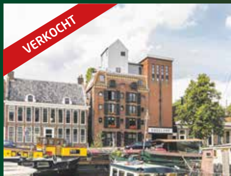
Noorderhaven 19-6 Groningen