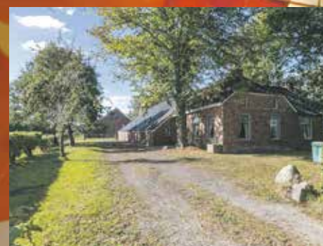
Zuidlaarderweg 55, Noordlaren € 695.000,- k.k.