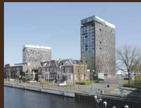
Het Hout 57, Groningen € 449.000,- k.k.