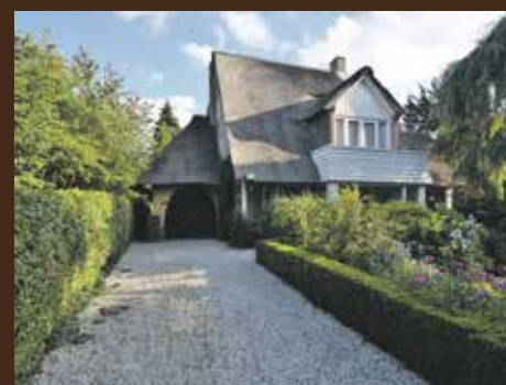
Molenweg 25, Haren € 695.000,- k.k.