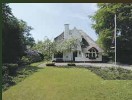
Lutsborgsweg 11 Haren, € 935.000,- k.k.