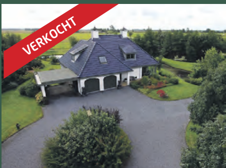
Matsloot 6 Matsloot € 549.000,- k.k.

Heeft u plannen om uw huis te gaan verkopen? Neem dan contact met ons op voor een vrijblijvend kennismakingsgesprek.