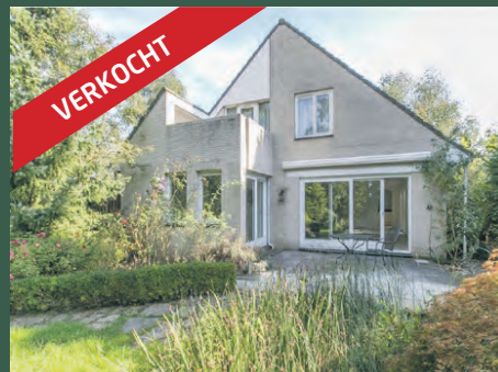
Van Leeuwenhoeklaan 3 Haren € 565.000,- k.k.