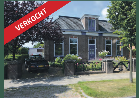
Rijksstraatweg 109 Haren € 675.000,- k.k.