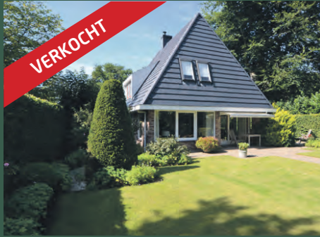
Oranjedreef 4 Haren € 549.000,- k.k.