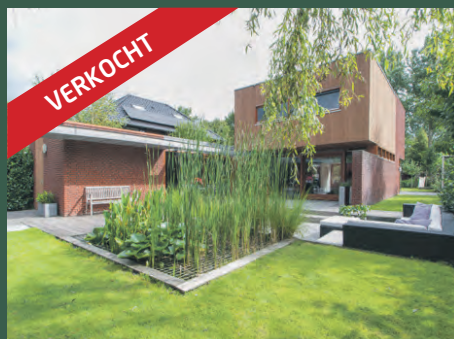
Ter Borchlaan 82 Eelderwolde € 719.000,- k.k.