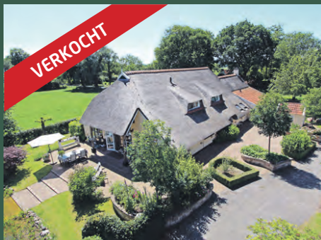
Zuidveld 6 Onnen € 749.000,- k.k.