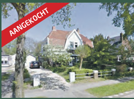
Middelhorsterweg 22 Haren