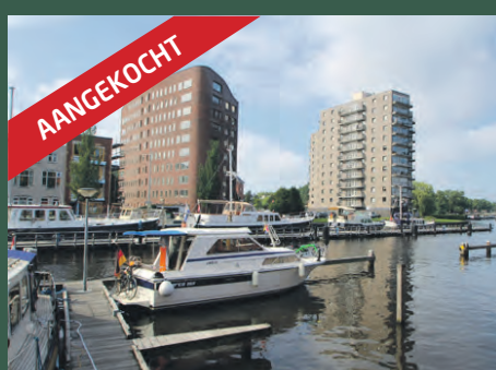
De Brink 71 Groningen