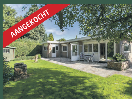
Mimosahof 11 Paterswolde