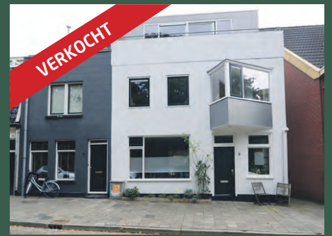
Noorderbinnensingel 77 Groningen € 375.000,- k.k.