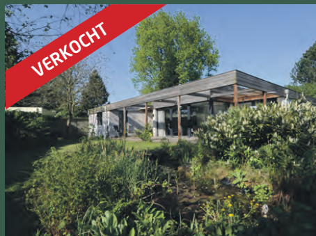
Aak 12 Kropswolde € 365.000,- k.k.