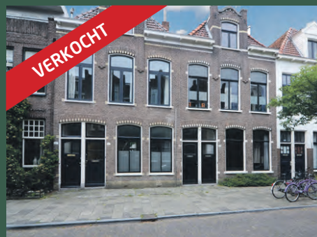
Anna Paulownastraat 42 Groningen € 498.000,- k.k.