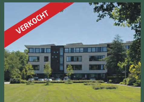
Henricus Muntinglaan 51 Haren € 435.000,- k.k.