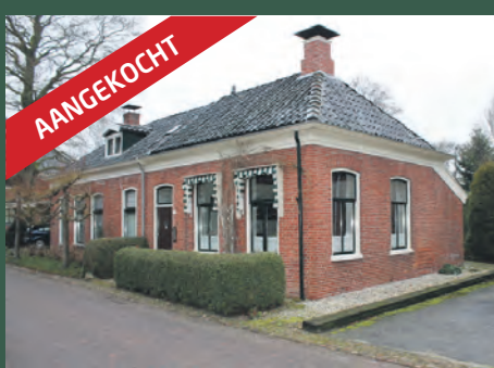
Kerkstraat 1 Noordlaren