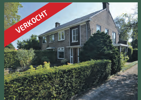
Lokveenweg 5 Haren € 359.000,- k.k.

Vestiging Groningen Coehoornsingel 117 9711 BR Groningen 050 534 45 33 info@alfredbakker.nl www.alfredbakker.nl