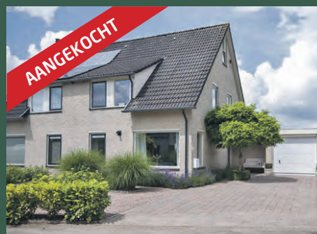
Bark 20 Kropswolde