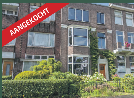
Noorderstationsstraat 48 Groningen