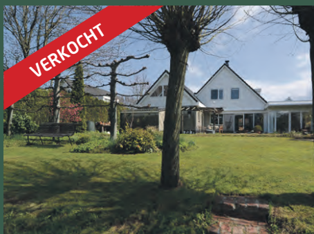
Broekstukken 42 Eelde € 499.000,- k.k.

Vestiging Haren Rijksstraatweg 233 9752 CA Haren 050 534 45 33 info@alfredbakker.nl www.alfredbakker.nl