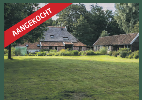
Boerlaan 18 Haren