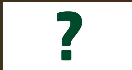
Compleet verbouwde 2 onder 1 kap bel voor meer informatie.