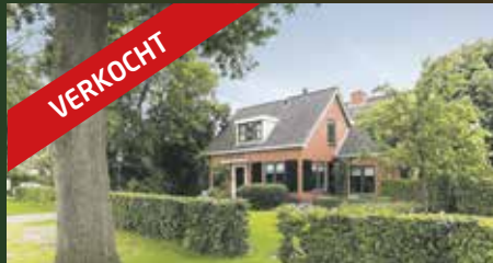
Annerstreek 27 Annen