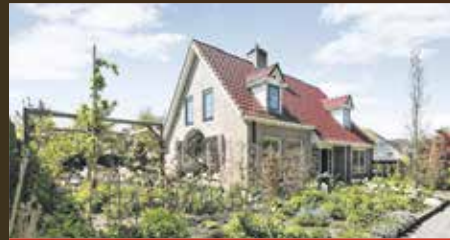
Borgsingel 37 Haren €599.000