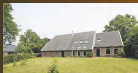
De Steeg 2 Tynaarlo €669.000