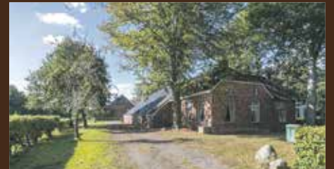
Zuidlaarderweg 55 Noordlaren €645.000