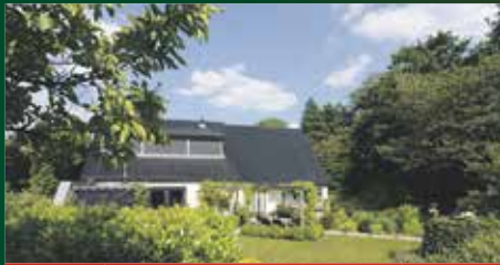
A Jacobsstraat 177 Groningen €798.000

U kunt hiervoor een afspraak maken door een email te sturen naar welkom@alfredbakker.nl of te bellen naar 050-5344533 .