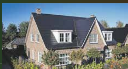
Sissinge 13 Zuidlaren €895.000