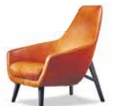
FAUTEUIL Montis Enzo