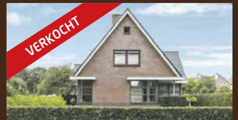
Mellenssteeg 4 Haren