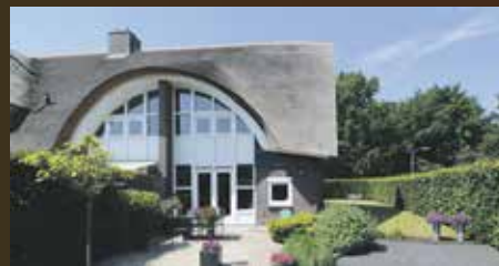
Hemmenkamp 34 Haren vanafprijs €539.000