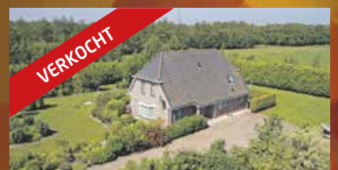
Zwarteweg 5 Tynaarlo