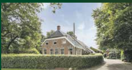
Kruisstraat 16 Annen €749.000