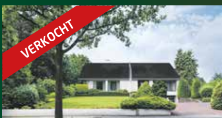
Rijksstraatweg 233A Haren