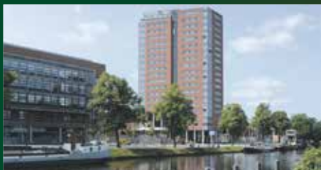
Emmasingel 40 Groningen €425.000