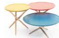
BIJZETTAFEL PICO Sculptures Jeux