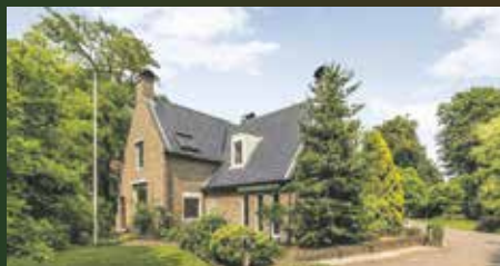
Rijksstraatweg 92 Glimmen €829.000