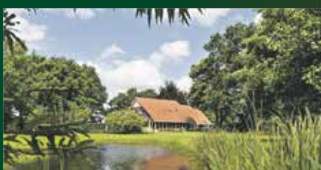
Watermolendijk 10 Eelde €725.000