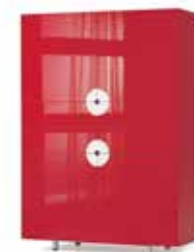
DISK KAST Castelijm KD-AA