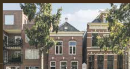
Trompstraat 18 Groningen €575.000