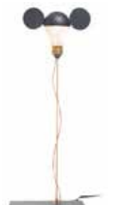
TAFFELLAMP I Ricchi Poveri - Toto Ingo Maurer