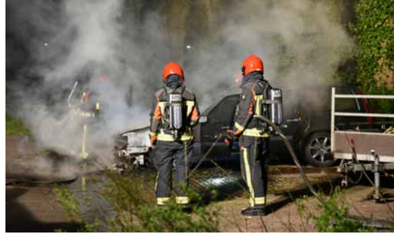
Eén van de autobranden op 4 mei aan de Heesterlaan in Haren.

De 27-jarige vrouw die in Haren eerder werd verdacht van het stichten van autobranden in Oosterhaar, is vorige week opnieuw aangehouden, nu in haar nieuwe woonplaats Groningen. Daar woont zij sinds twee maanden en de afgelopen weken zijn er in haar directe omgeving drie auto's in brand gestoken en is er brand gesticht in de tuin van haar buuren. Op 10 september rond half tien liep zij tegen de lamp en werd