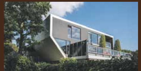
Hoofdweg 290B Paterswolde €849.000