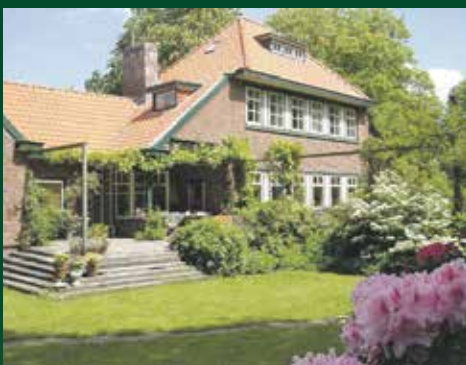
Westerse Drift 125, Haren € 995.000,- k.k.