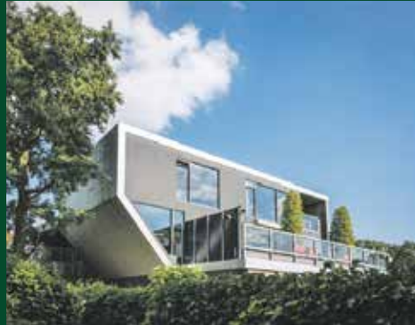
Hoofdweg 290B, Paterswolde € 849.000,- k.k.