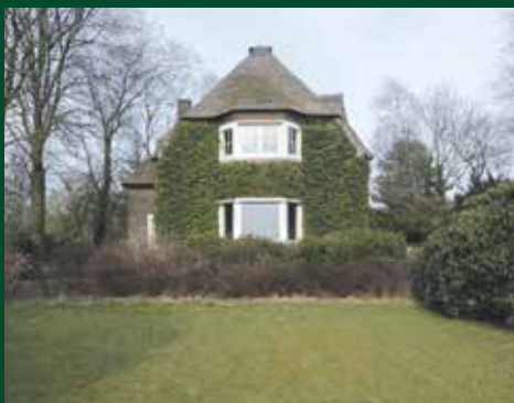
Rijksstraatweg 45, Haren € 1.275.000,- k.k.