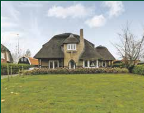
Meerweg 129, Haren Prijs op aanvraag