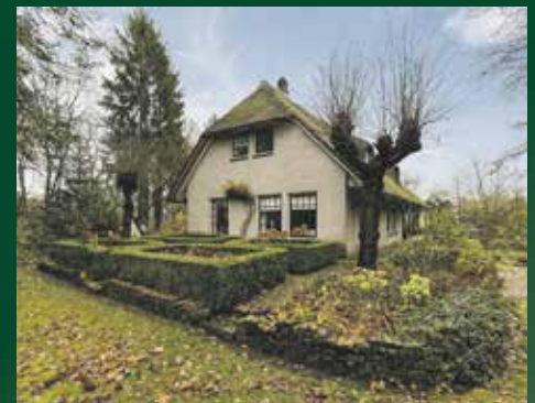
Stationsstraat 31, Tynaarlo € 539.000,- k.k.