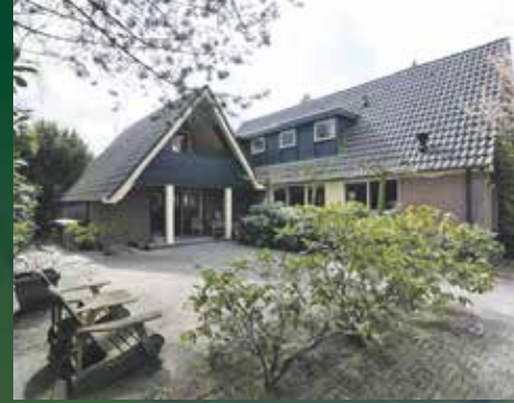
Zeemanweg 14, Haren € 785.000,- k.k.