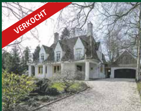
Rijksstraatweg 347, Haren