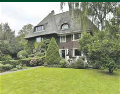
Verlengde Hereweg 156, Groningen € 795.000,- k.k.