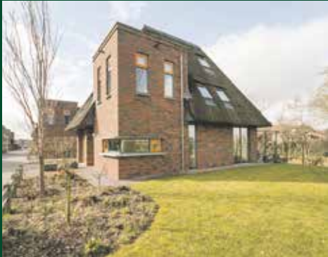
Drentselaan21, Groningen € 595.000,- k.k.

Ervaar het zelf. Koop of verkoop via Alfred!