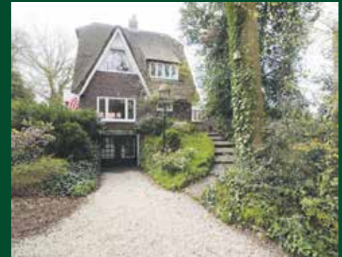
Oosterweg 14, Haren € 789.000,- k.k.