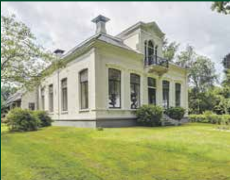
Lageweg 37, Noordlaren € 579.000,- k.k.