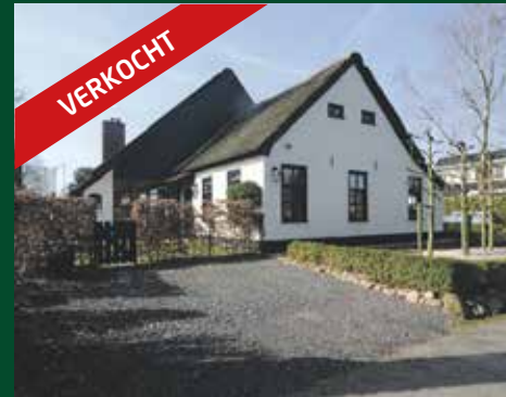
Middelhorsterweg 71, Haren