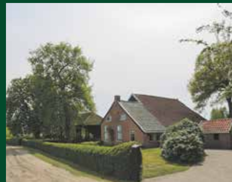
Schutsweg 34, Midlaren € 889.000 k.k.