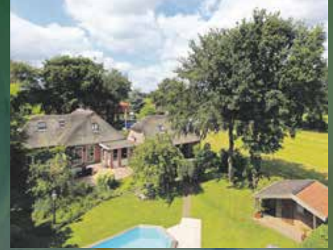
Zuidlaarderweg 1 Annen € 510.000,- k.k.