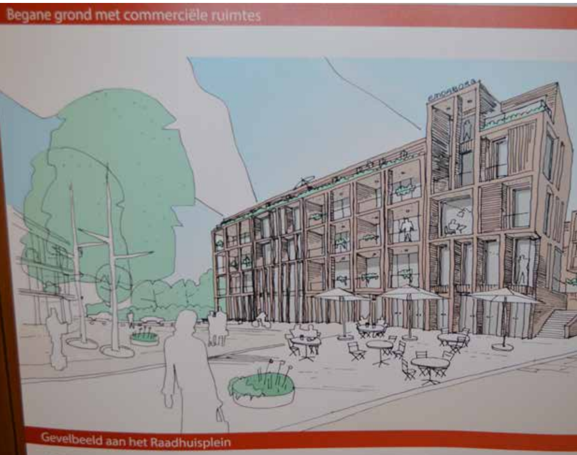
foto: Illustratie nieuwbouw

Het College van B en W heeft 1 mei een brief gestuurd aan de gemeenteraad, nadat er enige onrust was ontstaan onder omwonenden van het Raadhuisplein. In de brief zegt het College niet te willen talmen met het vaststellen van het bestemmingsplan met het oog op de bouw van winkels, woningen en een supermarkt (met parkeergarage).