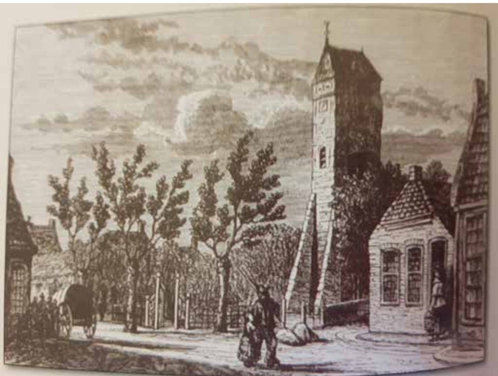
Het centrum van Haren, getekend in 1824. (Eerste periode)

Afgezien van enige rijke inwoners uit de stad Groningen, die – meestal alleen zomers – op hun landhuizen in de gemeente wonen, blijft Haren vooral een boerendorp met enige aan de landbouw gerelateerde bedrijvigheid, zoals de molens en tegen het einde van de periode de zuivelfabrieken. Alleen in het dorp Helpman ontstaat door de nabijheid van de stad wat meer industriële ontwikkeling. In 1892 wordt burgemeester Jorissen