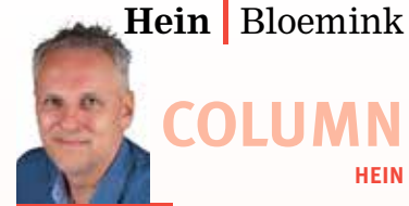
Hein | Bloemink

vak! Het plezier in mijn werk zal ik zeker behouden, zolang ik kan genieten van kinderen die vol trots en verwachting hun zelfgekozen boek aan hun ouders laten zien: ja, deze wil ik mee!