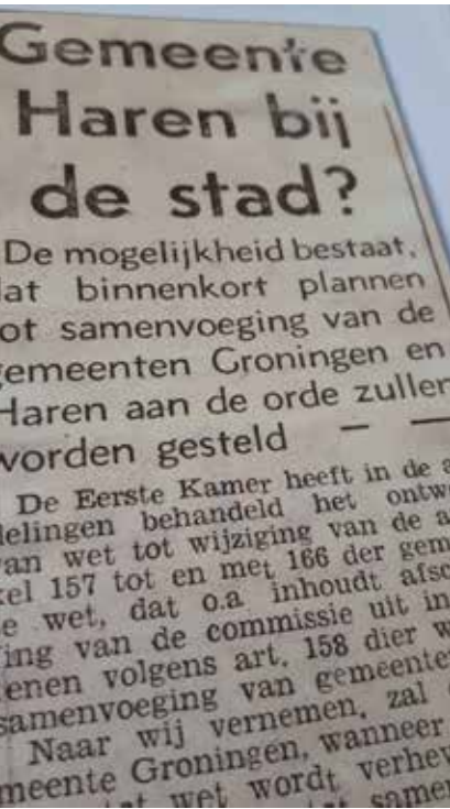
Al in 1946 werd gespeculeerd over een fusie, die pas in 2019 zou plaatsvinden...