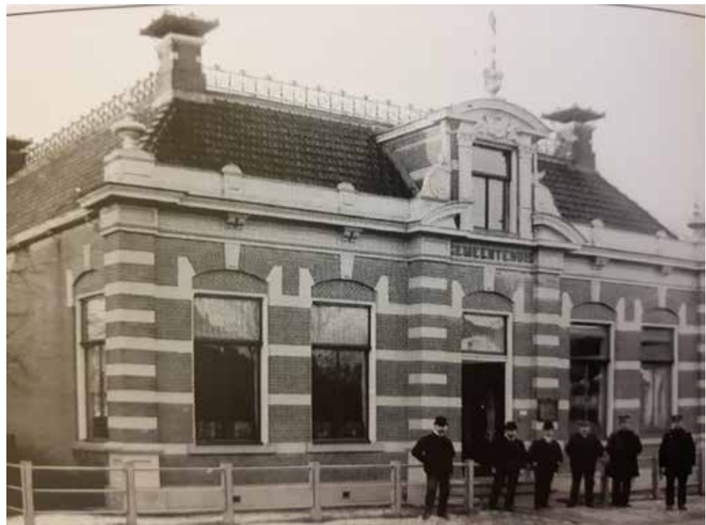
Gemeentehuis in het centrum van het dorp rond 1900. (Tweede periode)