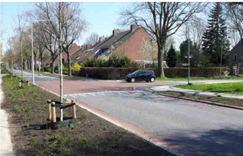
Emmalaan en de gelijkwaardige kruising met Spinozalaan...