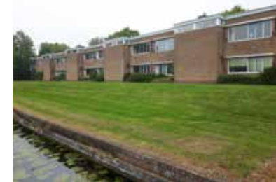
Het gebouw dat wordt aangepast...