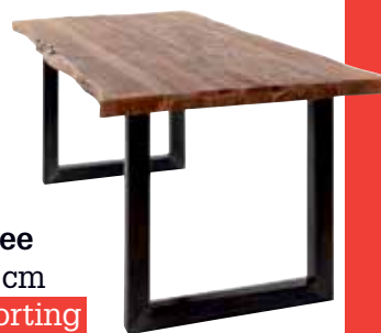
Eettafel Tree 200x90x78 cm Met 20% korting

20% korting op voorraadmeubels bij de afdeling Wonen*