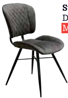
Stoel Abigail Donker- of lichtgrijs Met 20% korting