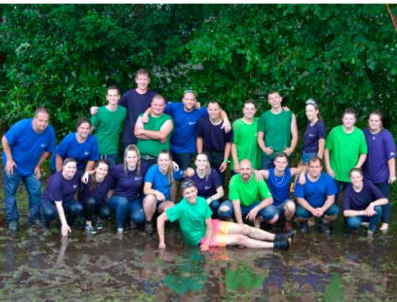
Enthousiaste vrijwilligers van het Huttenbouwdorp

De organisatie van het jaarlijkse Huttenbouwdorp Haren maakt zich zorgen over de toekomst van dit evenement. Dat heeft te maken met de gevolgen van de fusie met de Gemeente Groningen. Sinds 1984 was deze activiteit een soepel samenspel van bedrijven, gemeente en vrijwilligers. Maar de gemeente haakt nu af.