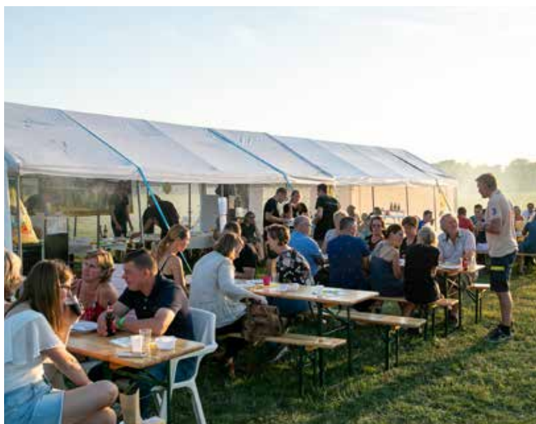
Op en top Noordlaren