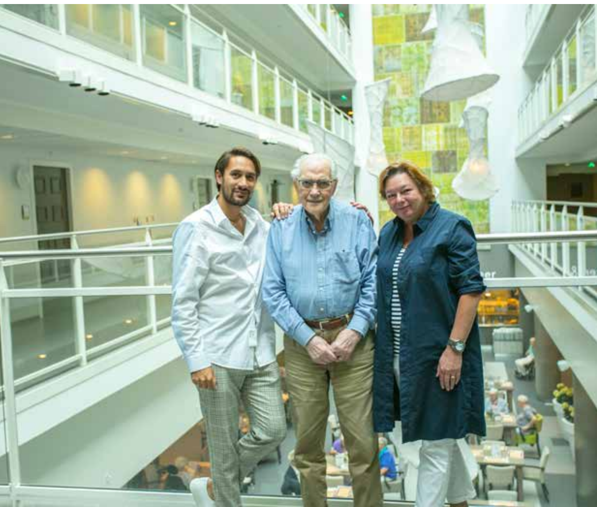
De schatgravers omringen de kunstenaar