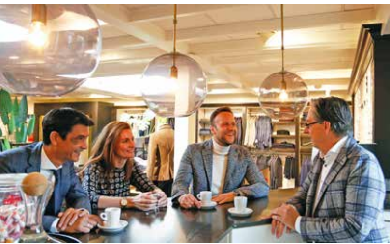
Gezelligheid troef bij Flashman (Germen op de foto tweede van rechts).