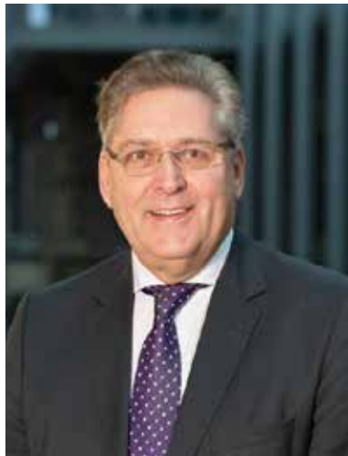
Henk Krol 50Plus

Eind oktober maakte Henk Krol van 50Plus in de Tweede Kamer een begin met de reflectie op het fusieproces in Haren. Als dat proces tussen 2013 en 2019 als een wedstrijd wordt voorgesteld, dan wil Krol nu een zorgvuldige analyse van het spel, om te zien waar het is misgegaan. Want Krol vindt dat de fusie slecht uitpakt voor Haren. Daar kan op dit moment niemand iets aan doen, maar men kan wel kijken of de wedstrijd eerlijk is gespeeld. Een VAR voor het fusieproces.