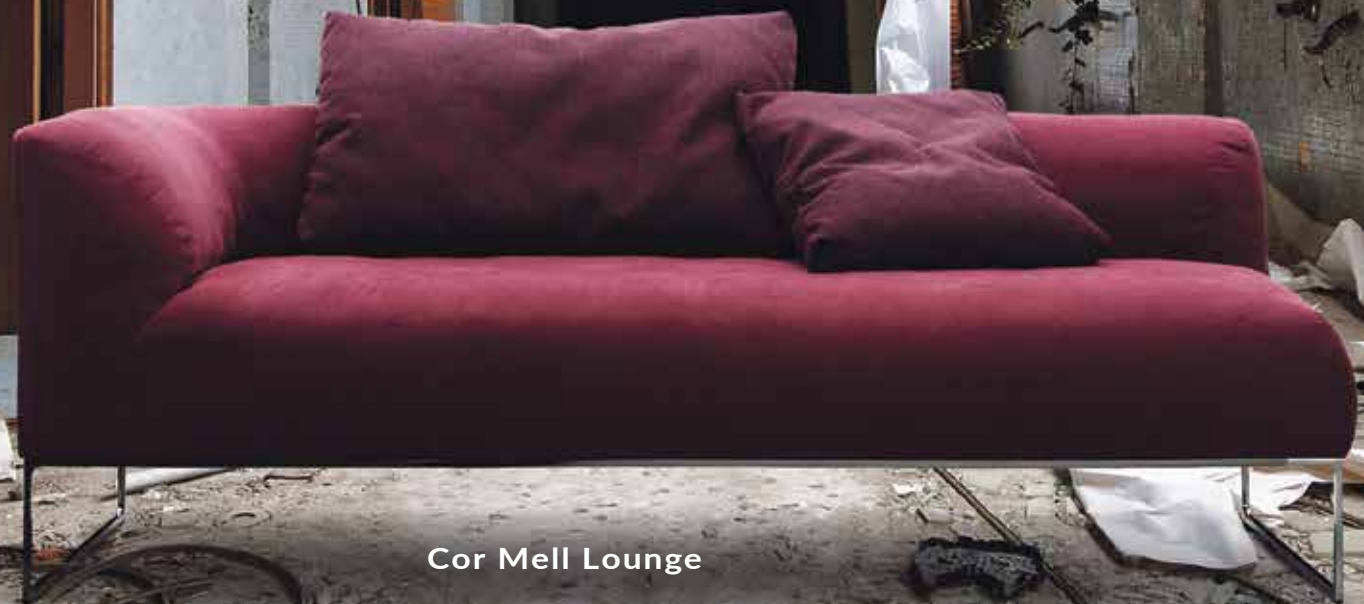
Cor Mell Lounge

INTERIEURS VOOR LIEFHEBBERS VAN INTERIEURS