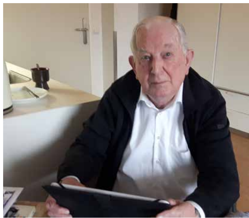
Rien Huizing in zijn woning in De Dilgt te Haren.

Van 1965 tot 1984 was Rien Huizing dagelijkse gast in vrijwel alle huiskamers in Nederland, als nieuwslezer van het NOS Journaal op televisie. In een tijd van weinig zenders had het journaal de autoriteit om te bepalen welk nieuws gebracht zou worden. Op de vraag wat nieuws eigenlijk is zegt Huizing met een lach: "Eigenlijk is nieuws datgene wat de eindredacteur nieuws belijft te noemen." Journalist Rien Huizing (1931) is na zijn loopbaan via Friesland vorig jaar neergestreken in Haren, het 'bijzondere dorp' dat hij goed kent uit zijn jeugd.