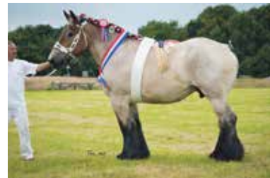
Het paard Gemma dat door de Harenaar is verkocht aan de Italiaanse zanger