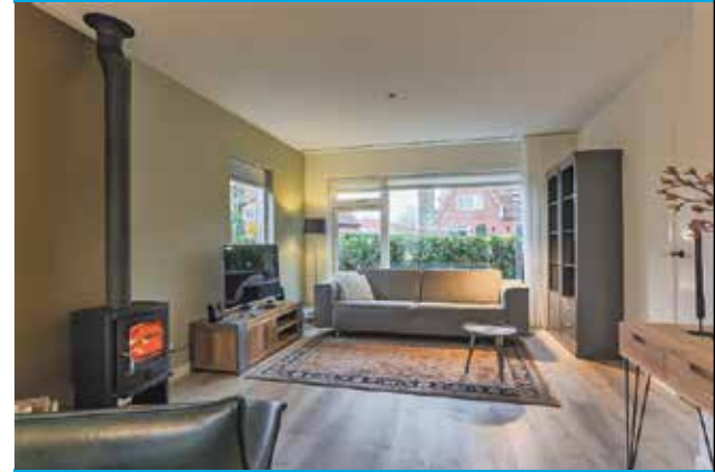
VERKOCHT Middelhorsterweg 88 Haren