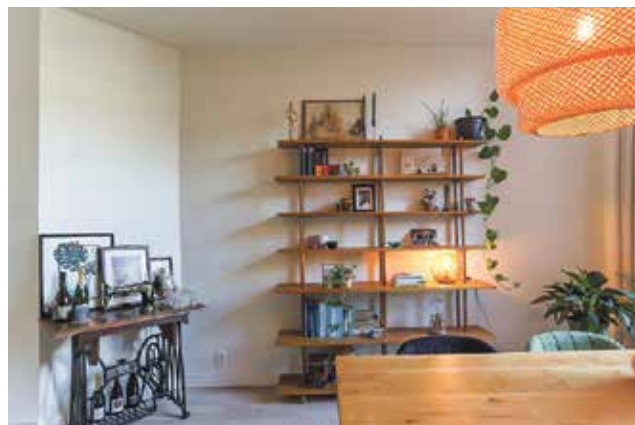
AANGEKOCHT De Ranitzstraat 13A Groningen