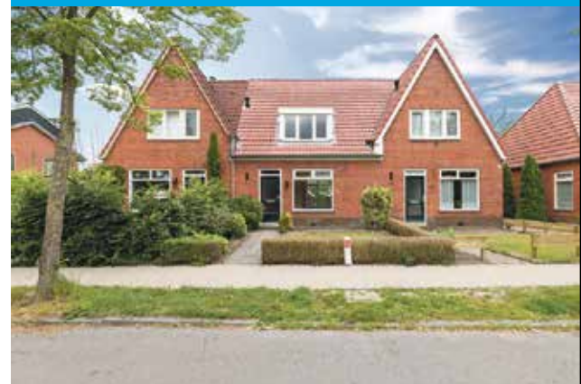
VERKOCHT Molenkampsteeg 39 Haren