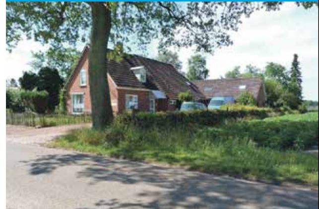
AANGEKOCHT Tienelsweg 42 Zuidlaren