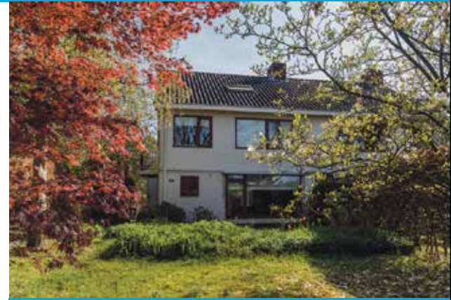
AANGEKOCHT Lutsborgsweg 24 Haren