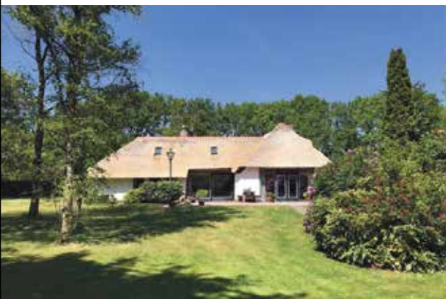
VERKOCHT Varik 1 Gieten