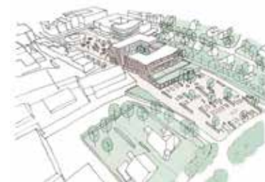
Impressie van het bouwblok volgens de website van Explorius

Bij vluchtige lezing van het raadsvoorstel leek het overigens alsof de gemeente wilde afzien van horeca