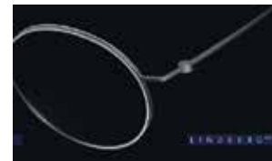
LINDBERG thintanium: ultra licht en modieus.

Vorige maand vertelden we u al over de LINDBERG-collectie. Als Premium-dealer hebben wij een zeer grote collectie op voorraad. Zelfs de allernieuwste serie LINDBERG thintanium is al binnen. Kom gerust passen.