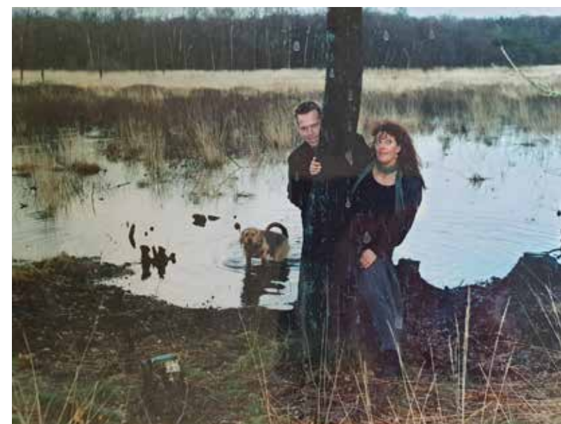
Trouwfoto in 1995, Appèlbergen. Bevrijd van de drugs.

*Echte naam van deze Harense is bij de redactie bekend.