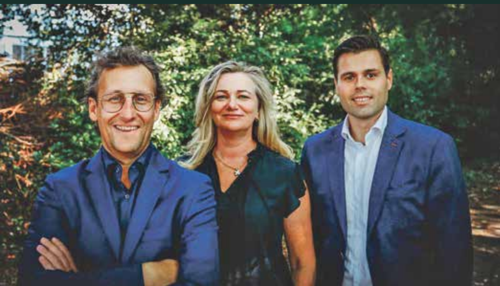
Team Alfred Bakker Makelaars

Meer weten? Zoek niet verder en maak een vrijblijvende afspraak voor een kennismaking op ons kantoor of bij u thuis.