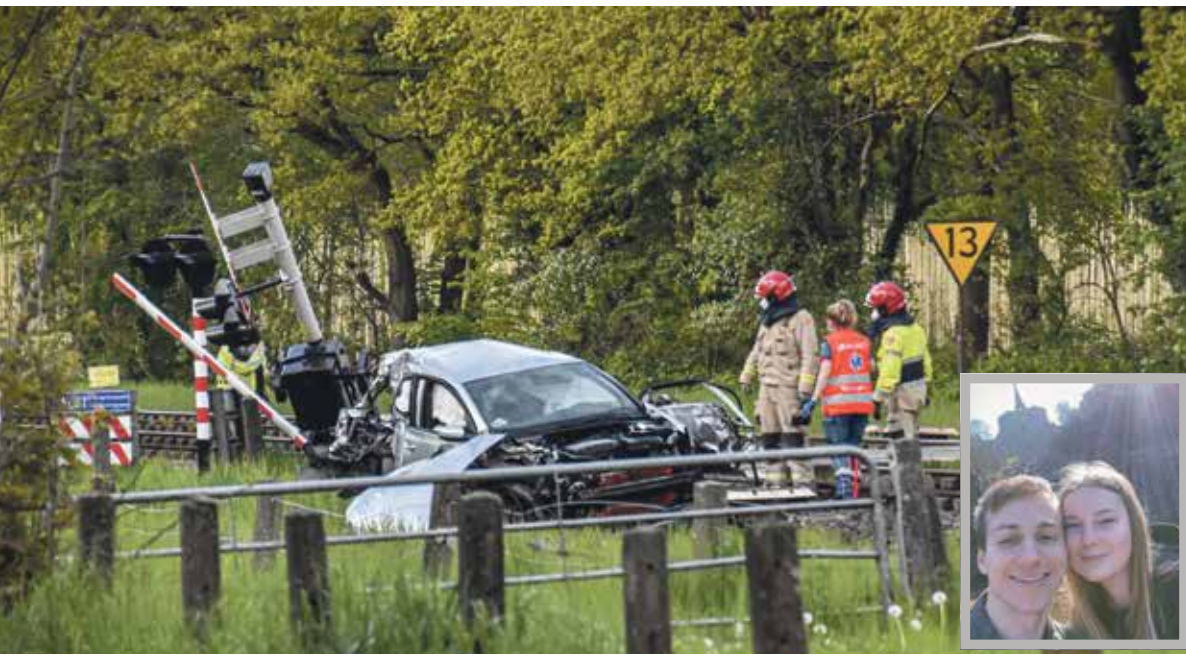
foto: Het wrak op de rails (112 Groningen/Haren de Krant Thijs Huisman)