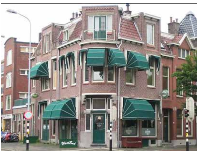
Friesestraatweg, in deze bovenwoning begon de ommekeer.

Ze leefde in een schijnwereld en probeerde op allerlei manieren geld te verdienen om haar shots te kunnen kopen. Ze is er niet trots op en schaamt zich er nog steeds voor. Heroïne kostte per gram meer dan 600 euro. “Ik had in mijn slechtste periode 375 euro per dag nodig om te kunnen spuiten.” Ze aanvaardde na jaren de helpende hand van de methadonverstrekking en vervoegde zich dagelijks aan dat vernederende loket, toen nog op het Damsterdiep. Totdat ze in 1980, staand voor het raam, besloot dat het genoeg was geweest.