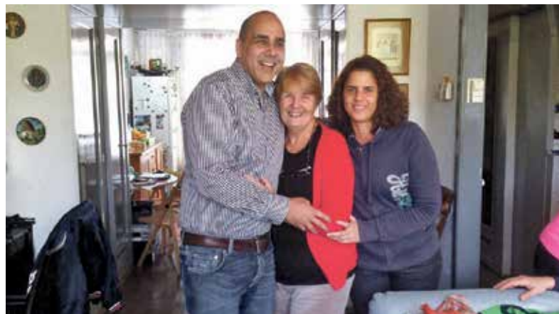
Gekoesterd door zoon en dochter, voordat haar gezondheid achteruit ging...(2020)

in Nederland een huis voor haar huurden in Rotterdam. Het voelde bepaald niet als thuiskomen, ook al was zij terug in haar geboortestad. Daar werd ze in het najaar van 2020 getroffen door een echte beroerte. Dat was de druppel. Haar kinderen gingen op zoek naar een mooie plek om te wonen met zorg in de buurt. En zij vonden: Verdi in Haren.