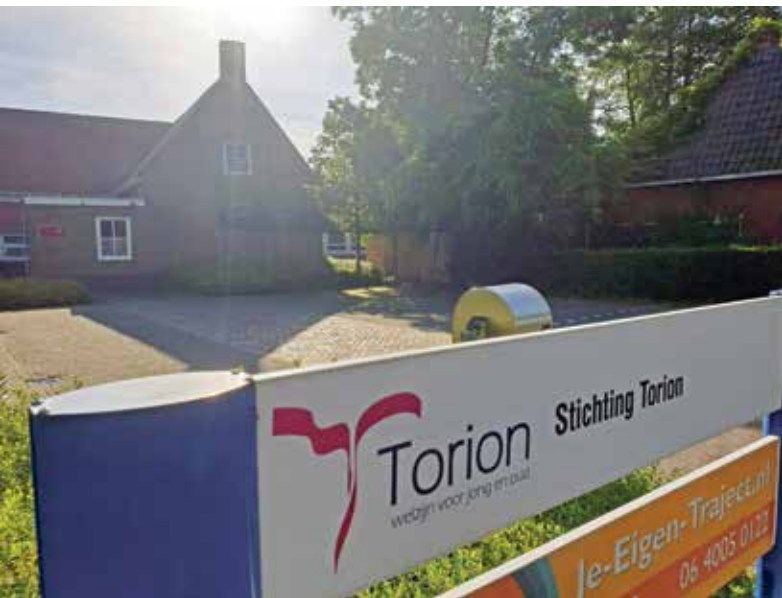
Het pand waar Torion nu nog is gevestigd

Op 1 januari 2022 eindigt een garantiestelling van de gemeente voor de financiering van Torion in Haren. Voor de fusie tussen Haren en Groningen werd afgesproken dat Torion tot die datum in ongewijzigde vorm haar welzijnswerk in Haren kon blijven verrichten. Daarvoor werd 3 ton per jaar gereserveerd. De vraag is nu: wat gebeurt er na 1 januari met Torion? En wat belangrijker is: houdt Haren haar lokale welzijnswerk?