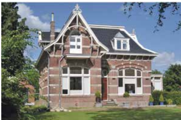
Huis zonder steigers, eindelijk...