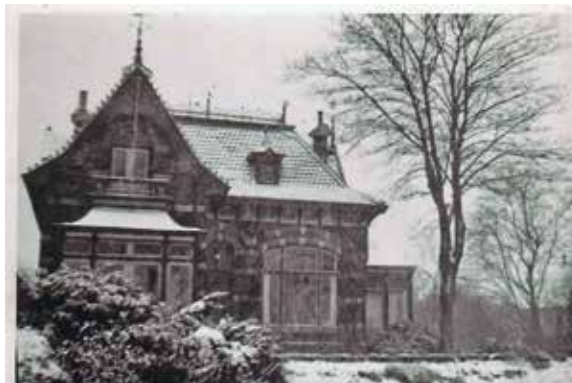
Het is 1925. Rond 1905 werd dit huis voor 600 euro verkocht op een veiling in de stad.