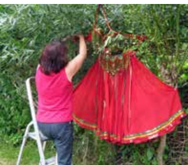
Eind aan een carrière als buikdanseres, na 36 jaar hangt ze haar pakje aan de wilgen.