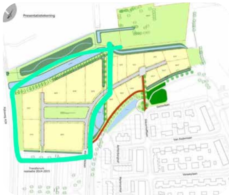
Het gebied waar het om gaat.