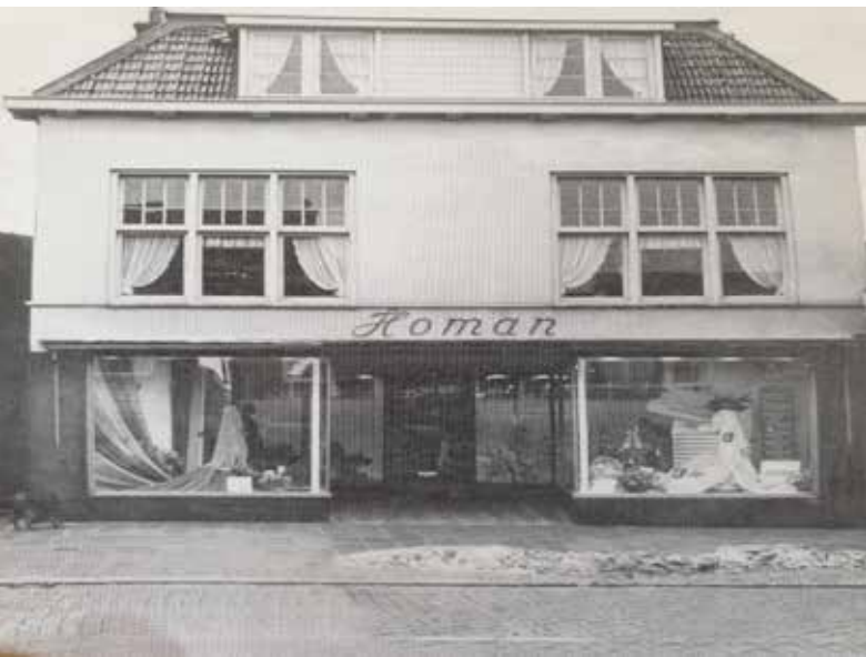
De winkel in 1955 toen de bedden werden toegevoegd aan het assortiment.

Geen heden zonder verleden. Het gerenommeerde winkelbedrijf Homan Slapen (in Assen en Haren) bestaat 110 jaar en is daarmee waarschijnlijk de oudste winkel in Haren. Anno 2021 staat de vierde generatie Homan (Rubert) aan het roer. Hij loodste de zaak de 21e eeuw binnen en maakte er een eigentijds bedrijf van, dat zich ook op internet en social media laat zien.