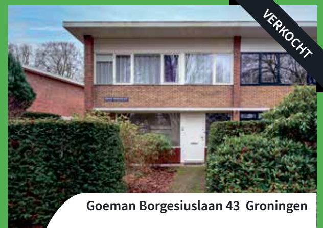
Goeman Borgesiuslaan 43 Groningen