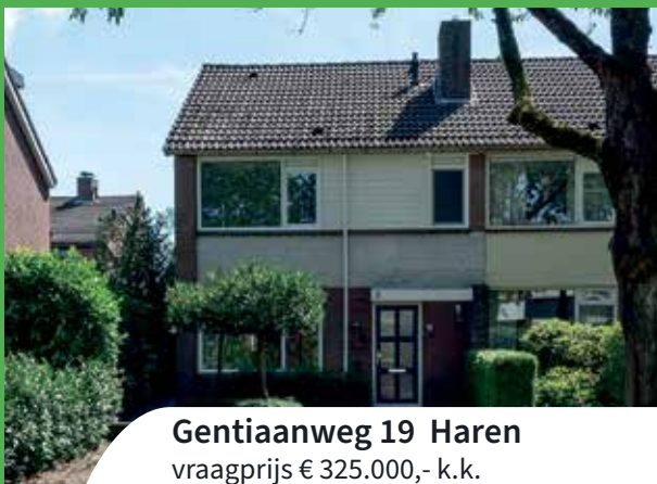
Gentiaanweg 19 Haren vraagprijs € 325.000,- k.k.