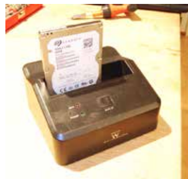
Harde schijf gratis

Vissinga snapt niet dat mensen trouw statiegeldflessen inleveren, maar zo’n kostbare mediabox weggooid. Vissinga: “Ik wil mensen bewust maken dat we zuinig moeten omgaan met de aarde.” Het weggooiden van de mediaboxen is nu actueel, maar Vissinga weet dat er ook dagelijks dvd-recorders worden gedumpt inclusief hun harde schijf. Hij vindt dat zonde.