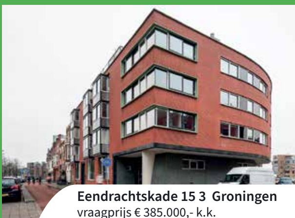
Eendrachtskade 15 3 Groningen vraagprijs € 385.000,- k.k.