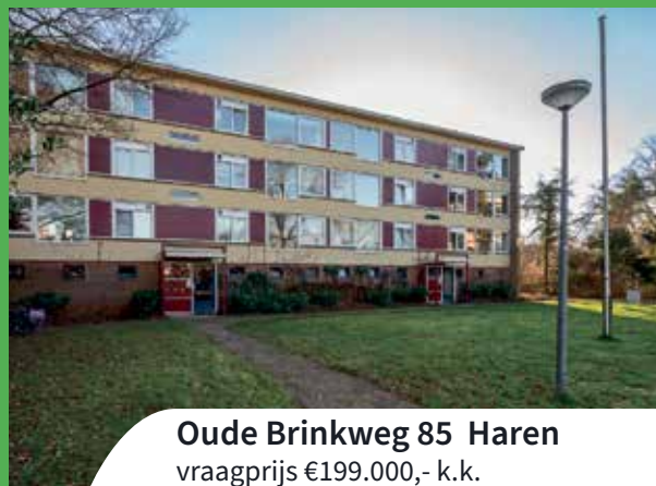
Oude Brinkweg 85 Haren vraagprijs €199.000,- k.k.