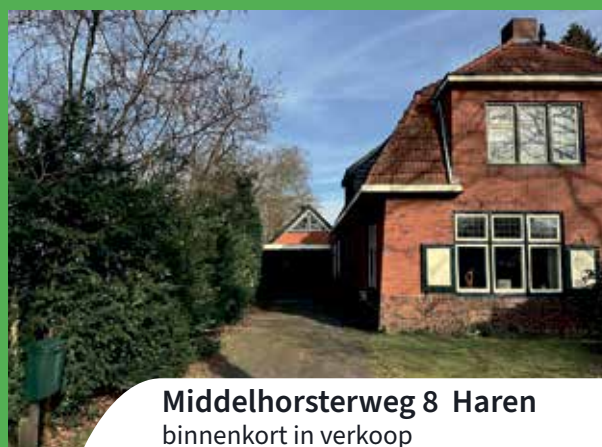
Middelhorsterweg 8 Haren binnenkort in verkoop