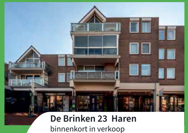
De Brinken 23 Haren binnenkort in verkoop