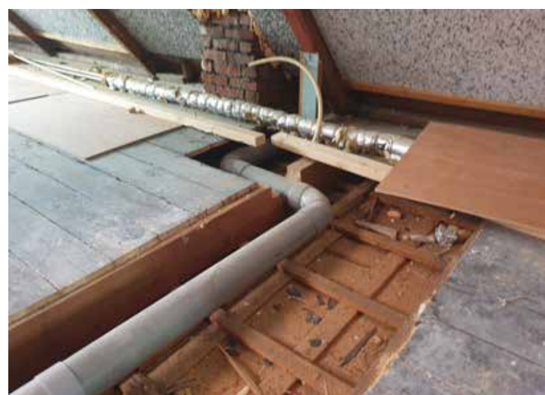
Doorgezaagde dragende balken