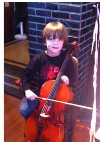
Foto: 5 jaar oud, het begon in 't Clockhuys