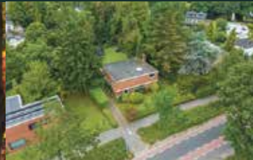
Goeman Borgesiuslaan 155 € 1.189.000,-