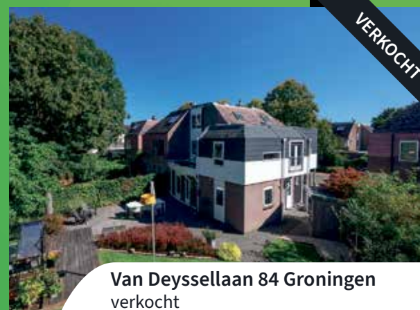
Van Deysellaan 84 Groningen verkocht