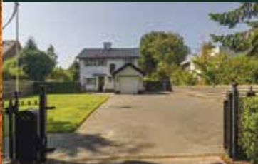
Essertlaan 7, Groningen € 839.000,-