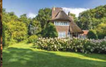
Stationsweg 20, Haren