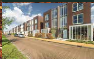
Vasalislaan 122, Groningen