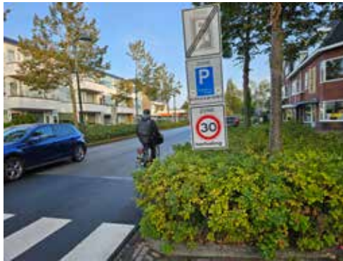
Resultaat van jarenlang brieven schrijven en discussiëren met de gemeente.