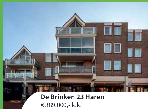
De Brinken 23 Haren € 389.000,- k.k.