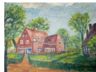
Schilderij van het pand in 1923