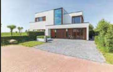
De Oeverlilbet 11, Eelderwolde