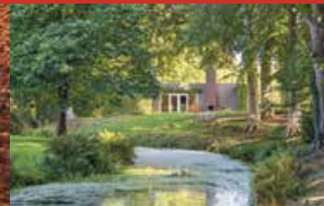
Rijksstraatweg 65, Haren