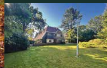
Westerse Drift 99, Haren

Staat jouw huis straks ook als verkocht op deze pagina?