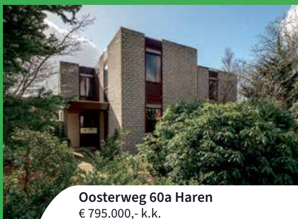
Oosterweg 60a Haren € 795.000,- k.k.