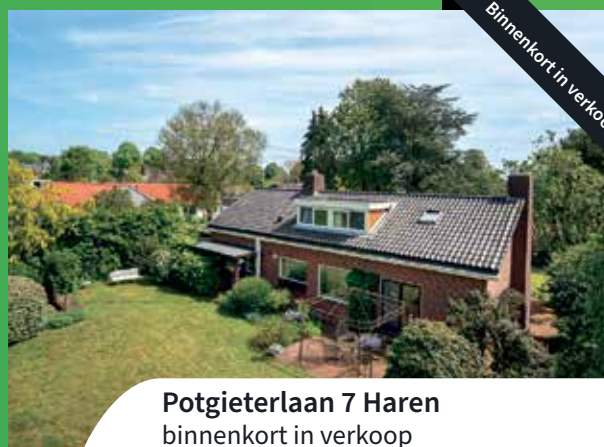
Potgieterlaan 7 Haren binnenkort in verkoop