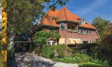
Emmalaan 19, Haren € 975.000,-