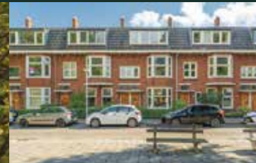
Savornin Lohmanplein 11, Groningen € 449.000,-