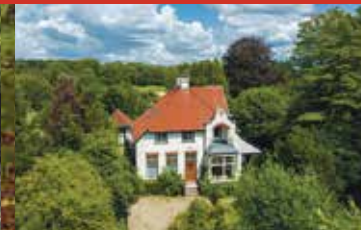
Rijksstraatweg 350, Haren