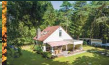
Grote Kampweg 10, Norg € 479.000,-