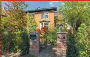
Oosterweg 1, Haren