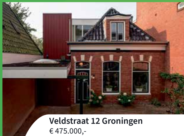
Veldstraat 12 Groningen € 475.000,-