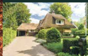
Westerse Drift 78, Haren