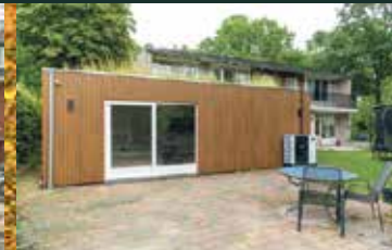
Goeman Borgesiuslaan 147, Groningen € p.o.a.