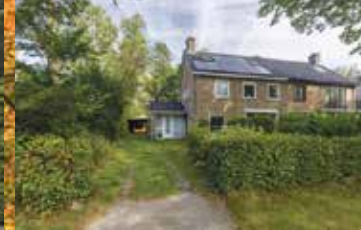
Dilgtein 7, Haren € 649.000,-