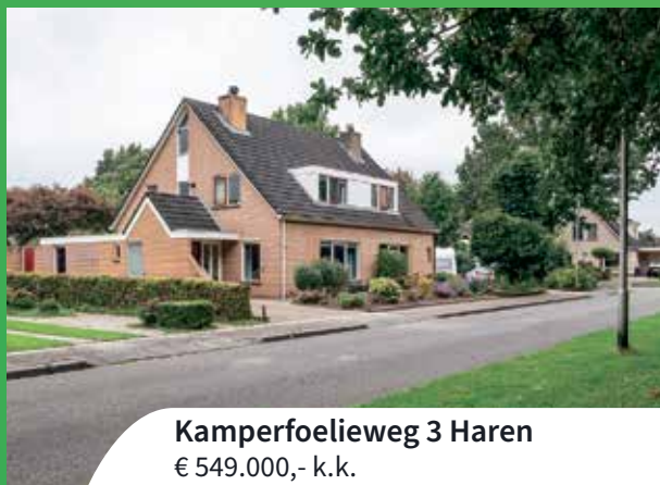
Kamperfoelieweg 3 Haren € 549.000,- k.k.