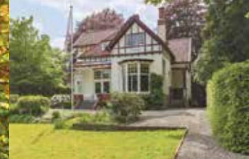
Vertengde Hereweg 175, Groningen