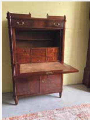
Secrétaire Louis XVI Gedateerd: ca. 1820