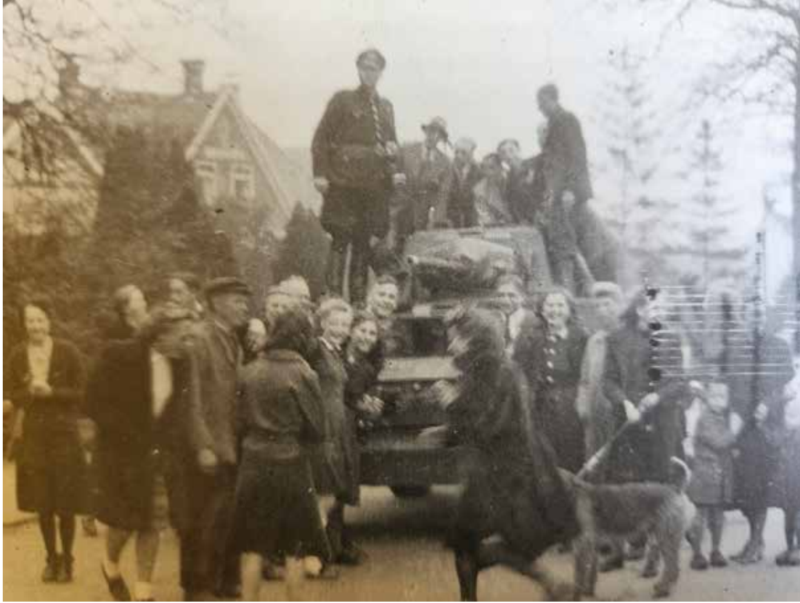
Rijksstraatweg in Harenermolen, 15 april 1945. Uit: Harener Historische Reeks deel 9 (pagina 63) Uitgeverij Knoop en Boomker (1995)